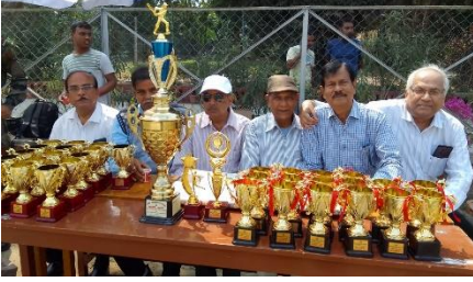
ক্রিকেট ম্যাচের মাঠে প্রাক্তনীরা

অনুষ্ঠিত হয়েছে। ১৯৭১-থ্রাজুয়েট ব্যাচের প্রাক্তনীদের অর্থানুকূল্যে ও বিশেষ উদ্যোগে এই প্রতিযোগিতা আয়োজিত হয়ে থাকে।