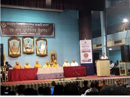
দ্বিপ্রাহরিক পুনর্মিলন সভায় স্মৃতিচারণরত প্রাক্তনী

দুপুর ১টা থেকে শুরু হয় মধ্যাহ্নভোজন। পুনর্মিলন উৎসবে ৭৫৮ জন প্রাক্তনী, ২৭০ জন প্রাক্তনীদেবর সঙ্গে আগত অতিথি এবং ১০৪ জন আমন্ত্রিত অতিথি অংশগ্রহণ করেছিলেন। বর্তমান ছাত্র, সারদাপীঠের সমস্ত কর্মীসহ মোট প্রায় ২১০০ জন মধ্যাহ্নভোজনে উপস্থিত ছিলেন।