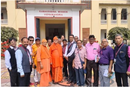
পুনর্মিলনে মহারাজদের আবার কাছে পাওয়া

পুনর্মিলন উৎসব: বিদ্যামন্দির প্রাক্তনী সংসদ করোনো-অতিমারী-উত্তরপর্বে স্বল্প সময়ের সিদ্ধান্তে, নতুন উদ্যোগে ২৭ মার্চ ২০২২ তারিখে পুনর্মিলন উৎসব আয়োজন করেছিল। এ-বছর (২০২৪) প্রাক্তনী সংসদের ২৮-তম পুনর্মিলন উৎসব অনুষ্ঠিত হল। সারাদিনব্যাপী আয়োজিত এই অনুষ্ঠানে প্রাক্তনী ও তাদের পরিবারবর্গের উপস্থিতি ছিল বিশেষভাবে উল্লেখযোগ্য। এই উৎসবে প্রায় ৭৫৮ জন প্রাক্তনী, ২৭০ জন অতিথি এবং প্রায় ১০৪ জন আমন্ত্রিত অতিথি উপস্থিত ছিলেন। প্রাক্তনী, অতিথি, আমন্ত্রিত অতিথি এবং বর্তমান ছাত্র মিলিয়ে সর্বমোট প্রায় ২১০০ মানুষের সমাগম হয়েছিল এই পুনর্মিলন উৎসবে। (বিস্তারিত প্রতিবেদন এই সংখ্যায় উল্লিখিত হয়েছে)।